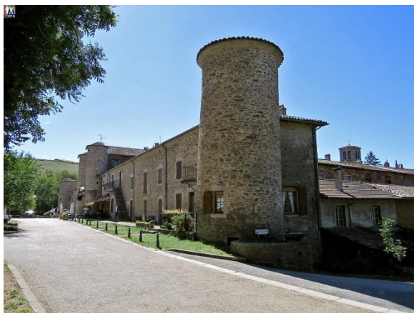
Ste CROIX EN JAREZ