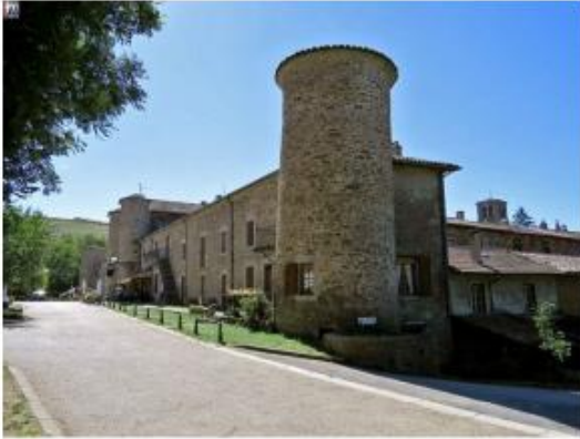
Ste CROIX EN JAREZ