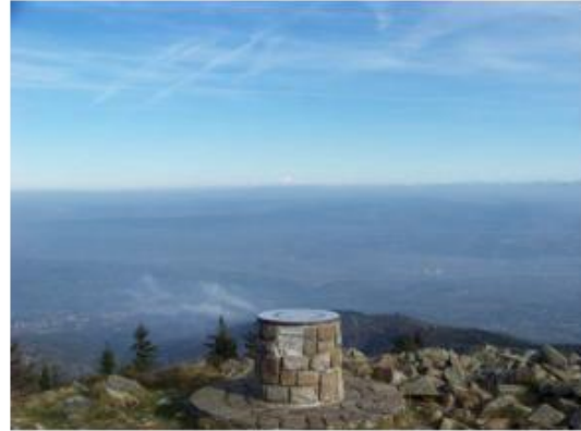
MONT PILAT - CRET DE L'OEILLON